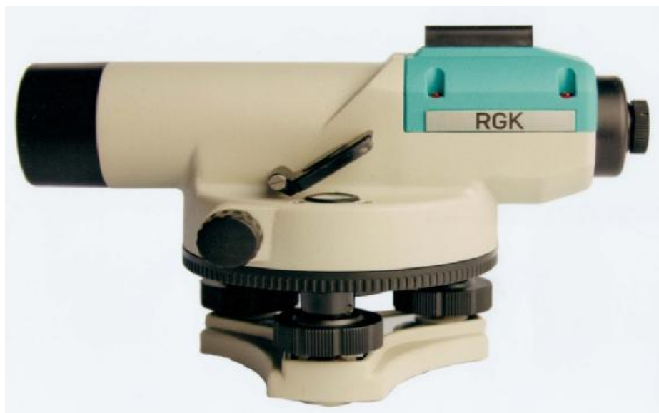
Рисунок 1 – Внешний вид нивелира сбоку

Внешний вид нивелира с указанием места пломбировки от несанкционированного доступа и места нанесения знака утверждения типа приведен на рисунках 1 и 2.